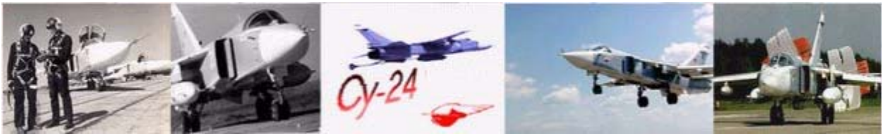
Сверхзвуковой военный самолёт “Су-24”