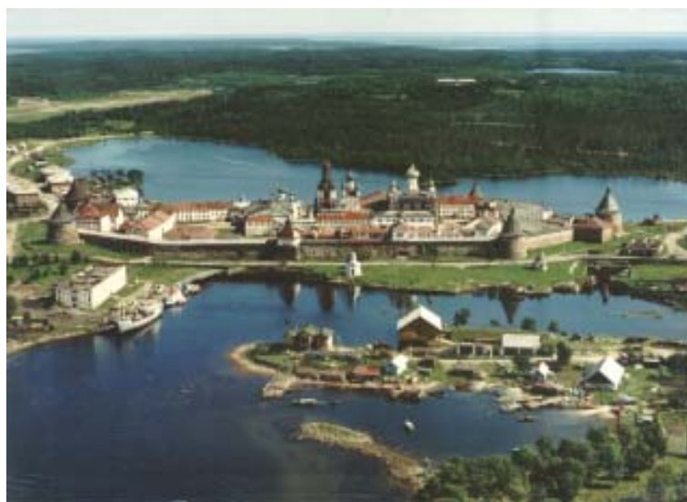
Монастырь на Онежском озере.